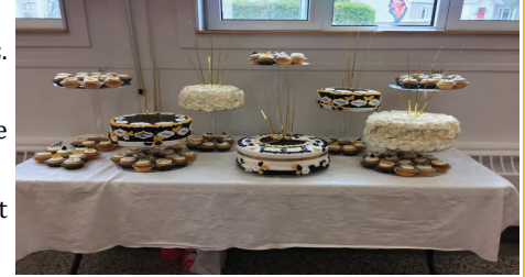
30 ans... ça se fête en grand !

RÉPAQ : Achat du livret (17 conditions) qui sera donné aux familles dès la rentrée 2017.