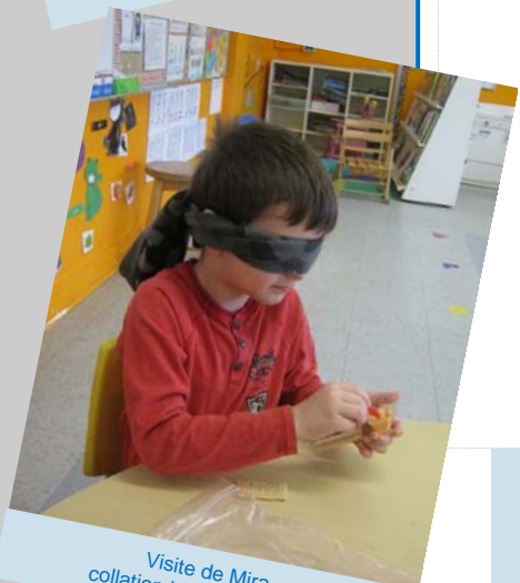
Visite de Mira collation les yeux bandés